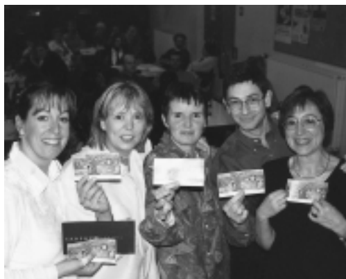
De winnaars van de vorige editie.

De cultuurraad zoekt ook nog vrijwilligers die willen meehelpen om tijdens de quiz de vragen uit te delen, antwoordformulieren op te halen, hulp bij de praktische proeven, enzovoort.