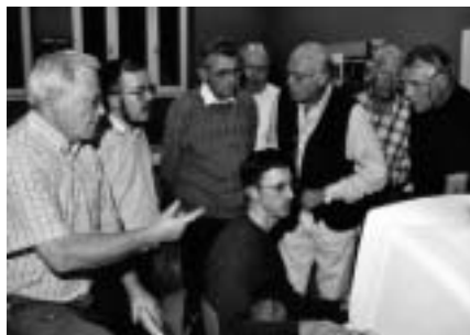
Werkavond in de videoclub: filmmontage met de computer.

En dan, voor diegenen die ons nog niet kennen, iets meer over het woord 'videoclub'. Dat kan verschillende betekenissen hebben. In ons geval staat videoclub voor een groep liefhebbers (door sommigen te verkiezen boven de eerder negatief klinkende benaming van amateurs) van het medium video, niet in de zin van film kijken maar van film maken . Je hebt misschien zelf ook een videocamera en je filmt er op los tijdens familiefeestjes en op vakantie? Meestal blijven die films tot de huiskamer beperkt omdat ze te lang zijn, omdat er ook onscherpe, scheve, slecht belichte beelden tussenzitten. 'Dat maakt voor mij geen verschil uit', hoor ik je zeggen. Dan moet je eens naar een