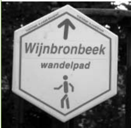
Nederlandstalige bordjes van de Wijnbrondal-wandeling zijn een doorn in het oog van het Franstalig schepencollege.