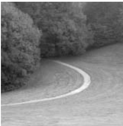
Hier maakt het wandelpad in het Schaveypark een mooie bocht. Eenmaal onder de bomen stopt het abrupt.

Enkele jaren geleden ging het gemeentebestuur over tot het bewegwijzeren van een aantal wandelingen. Of deze veel bewandeld worden, is zeer de vraag. Laat staan dat de mensen weten waar je de wandelingen kan beginnen en hoe de bewegwijzering eruit ziet.