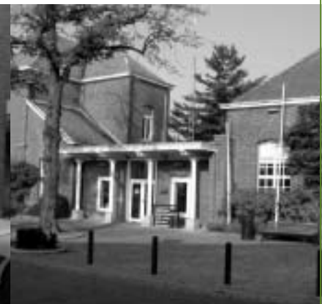
Uitbreiding van het gemeentehuis is dringend nodig.