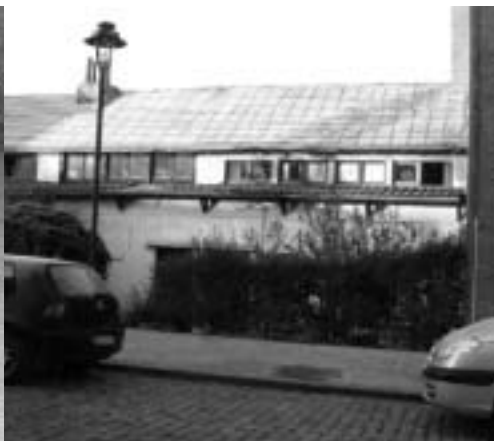
Krakers in deze vervallen huisjes?