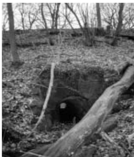
De ondertunnelde linkebeek in het Zoniënwoud.

klaring voor het woord 'Link' in Linkebeek. Ook in de 'Geschiedenis van Linkebeek', verschenen in 1957, neemt men de uitleg over van prof. A. Carnoy. 'Link' zou van Angelsaksische oorsprong zijn en 'hellend terrein' of 'heuvel' betekenen zoals de 'golf-links', een begraasde helling voor het golfspel. Helaas klopt deze uitleg niet. Op het ogenblik dat de naam ontstond (vóór 1190) waren deze grasgroene beekhellingen er niet. Hoewel grote gedeelten van onze gemeente toen reeds ontbost waren, vormden de beekoevers juist de uitzondering. Op de oude kaarten zie je een groen lint van bomen en struiken langs de beek. En, buiten enkele etymologische bezwaren, waren onze voorouders zeker geen Angelsaksers. De lieden die zich hier in het begin van de Middeleeuwen vestigden, kwamen uit het oosten. Het waren voornamelijk Frankische Germanen en bij hen had 'Link' een andere betekenis, nl. 'kronkel' of 'bocht', verwant met