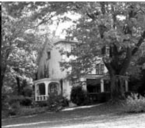
De vernieuwde Villa Lismonde opent op 15 november.

Die aangerichte schade is intussen door de provincie volledig hersteld. De oevers van de beek zijn versterkt en de wandelweg is opnieuw begaanbaar. Sedert jaren was deze wandelweg, die naast het OCMW-huis begint en tot aan de Alsebergsesteenweg loopt, voor een groot deel onbegaanbaar geworden. In het mooie landhuis langsheen deze weg woonde vroeger de bekende schrijver Herman Teirlinck.