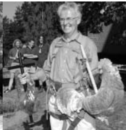
De nieuwe kerkhaan raakte uiteindelijk goed en wel op de torenspits.

De Franstalige vleugel van de Christelijke Mutualiteit opende in het voorjaar een kantoor in het IBOC-complex. Meteen het eerste Franstalig kantoor van een ziekenfonds in het Vlaams Gewest. De kans is dus niet denkbeeldig dat er in andere faciliteitengemeenten nog zullen volgen. De Socialistische Mutualiteiten deden bij het gemeentebestuur een verzoek om voor hun mobiel agentschap een vaste standplaats te krijgen op het Gemeenteplein tijdens de wekelijkse markt. Na overleg met de marktkramers is het schepencollege niet ingegaan op het verzoek.