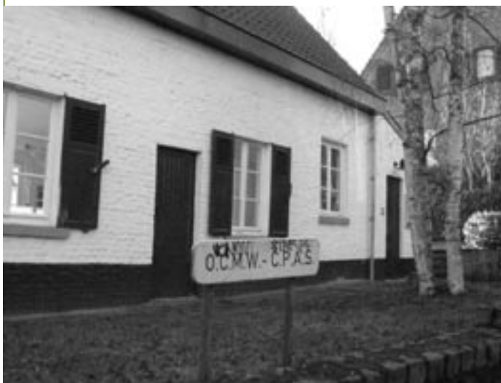
De OCMW-voorzitter lichtte de beleidslijnen en het budget van het OCMW toe.

> Vorig jaar kondigde het schepencollege voor dit jaar een mogelijke verhoging van de personenbelasting en de grondbelasting of onroerende voorheffing aan. Momenteel is daar echter geen aanleiding toe gezien het riante overschot in de gemeentekas. Van oppositiezijde had men dat vorig jaar al voorspeld en zelfs van belastingverlaging gesproken. Deze twee belangrijkste belastingen worden ongewijzigd op respectievelijk 6,2 % en 960 opcentiemen meerderheid tegen minderheid goedgekeurd.