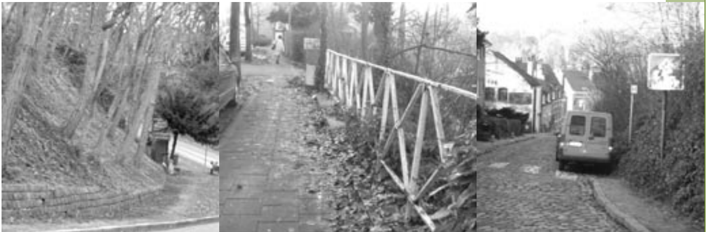
De oppositie vraagt meer aandacht voor de slechte toestand van wegen en voetpaden.

> De begroting 2004 van de kerkfabriek wordt eenparig gunstig geadviseerd. De toelage voor dit jaar werd op 16.450 euro vastgelegd. Voornaamste voorziene uitgaven in de gewone dienst zijn het schilderen van de pastorie (15.000 euro) en de herstelling van het orgel (25.000 euro). Het dossier voor de restauratie van de glasramen wordt verder afgewerkt met het oog op subsidies van de Vlaamse Gemeenschap. Het schepencollege gaat er niet mee akkoord dat de kerkfabriek voor de herstelling van het orgel geen lening aangaat. Aangezien het uiteindelijk toch om gemeentegeld gaat, heeft de oppositie daar geen bezwaar tegen omdat de gemeente momenteel toch over voldoende middelen beschikt. Waarom dan voor 25.000 euro een lening aangaan?