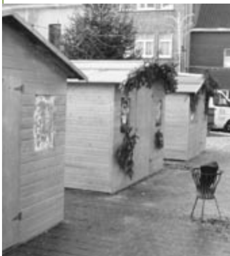
De dure kerstkramen lokten, mede door het weer, niet veel geïnteresseerden.

Op de Dapperensquare opende onlangs een wijnhandel de deuren. De reclame, die hierover verspreid werd, was ééntalig in het Frans, wat bij heel wat Vlaamse Linkebeekenaars niet op veel sympathie kon rekenen.