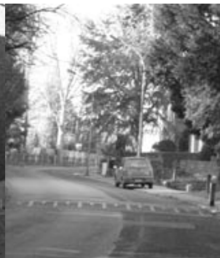
De Molenstraat zal in 2004 heraangelegd worden.