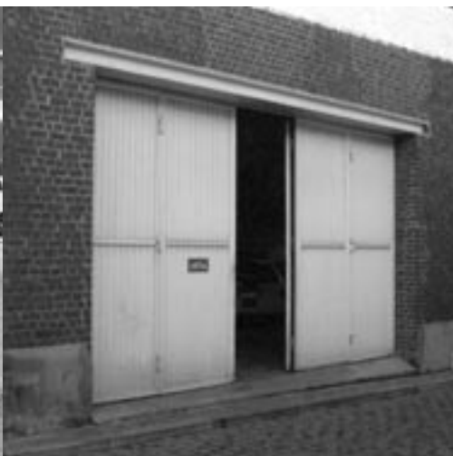
De bibliotheek zal niet kunnen uitbreiden met de aanpalende garage.