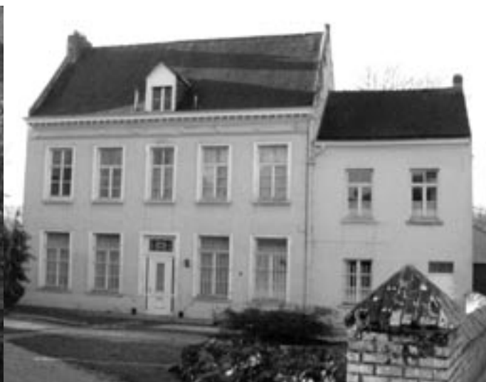
De pastorij zal in 2004 een schilderbeurt krijgen.