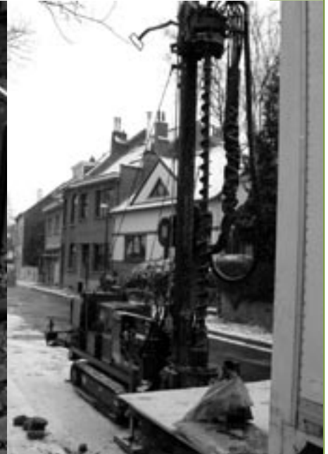
Stabiliteitsonderzoek in de Stationsstraat.

Net voor Kerstmis konden alle vrouwen tussen 50 en 69 jaar een gratis mamмоgrafie laten uitvoeren. Gedurende twee dagen kon dat in de ‘mammobil’, de rijdende screeningseenheid van het AZ-VUB van Jette. In onze gemeente kwamen 566 vrouwen hiervoor in aanmerking, 65 of 11,5% is op de uitnodiging ingegaan, wat ongeveer 2,5% meer is dan twee jaar geleden toen het gemeentebestuur het