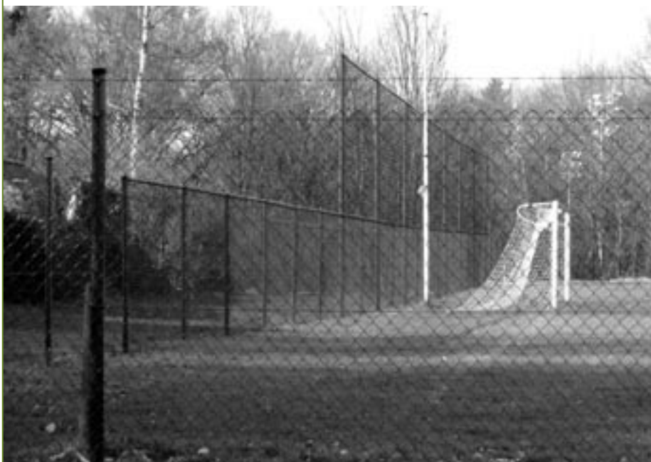
De omheining van de sportvelden kostte uiteindelijk 43.000 euro.

De omheining van de sportvelden achter het kerkhof en aan Den Bocht heeft uiteindelijk ongeveer 43.000 euro gekost, wat 5.700 euro minder is dan voorzien omdat een deel van de voorziene werken niet werd uitgevoerd. Na protest van de