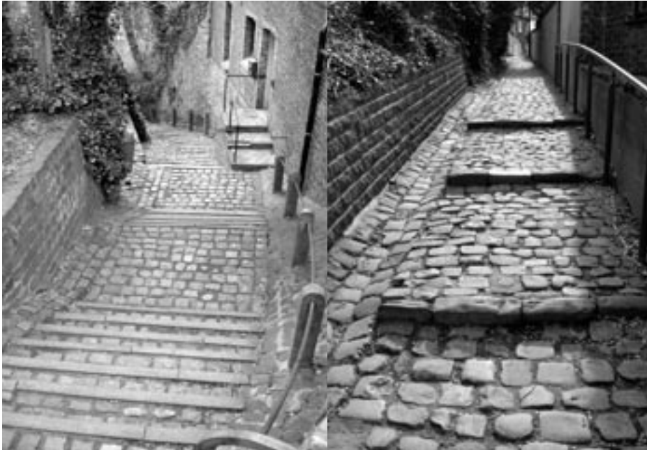
De trappen en het Pastorijpadje zullen verbeterd worden.

omwonenden en ook van oppositiefractie LK2000 werd een gedeelte van de natuurzone niet omheind zodat deze toegankelijk blijft voor wandelaars.