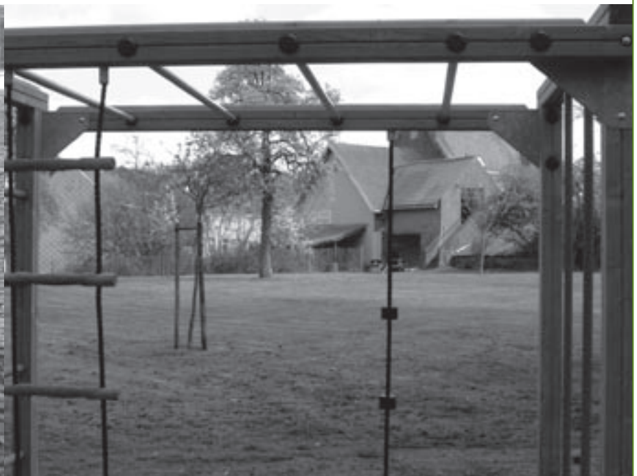
Hoeve 't Holleken maakte in 2003 winst.