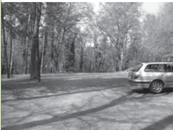
De parking aan het sportveld wordt beter verlicht.

> De gemeenteraad neemt kennis van het feit dat de provinciegouverneur de benoeming van een onderwijzeres aan de Franstalige gemeenteschool laattijdig heeft geschorst. De gouverneur schorste de benoeming omdat betrokkene niet over het vereiste taaldiploma beschikt, maar geeft toe dat de schorsing buiten de wettelijke termijn gebeurde en de gemeenteraad zelf maar moet beslissen om de onwettige beslissing in te trekken. De benoeming van Franstalige leerkrachten zijn in verschillende faciliteitengemeenten al geruime tijd een twistpunt omdat Nederlandstaligen en Franstaligen de taalwetgeving terzake anders interpreteren en de klachten bij de Raad van State daarover nog geen uitsluitsel brachten. Aangezien deze slordigheid van het provinciebestuur en van de Vlaamse Minister van Binnenlandse Aangelegenheden duidelijk in het voordeel van deze Franstalige onderwijzeres is, blijft de Linkebeekse meerderheid uiteraard bij haar grote gelijk. De oppositie herhaalt dat ze zich van deze benoemingen steeds heeft gedistantieerd.