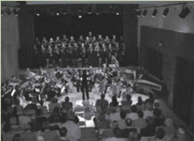
Sint-Ceciliakoor en Orfeus Academie brachten een mooi concert.

Dit alles resulteerde in een bijzonder druk werkjaar, dat overigens nog niet ten einde is. Het secretariaat van de Moelie zal