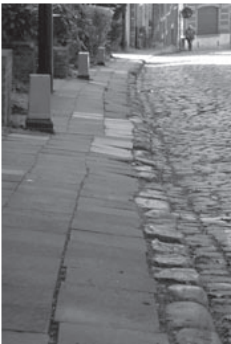
Verskillende voetpaden liggen er bedenkelijk bij.

In de buitengewone dienst van vorig jaar is er een verhoging van 220.000 euro