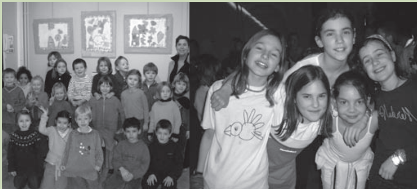
Kinderen genoten met volle teugen van al die leuke activiteiten in de Moelie.

Prachtig seizoen 2003-2004 bijna achter de rug