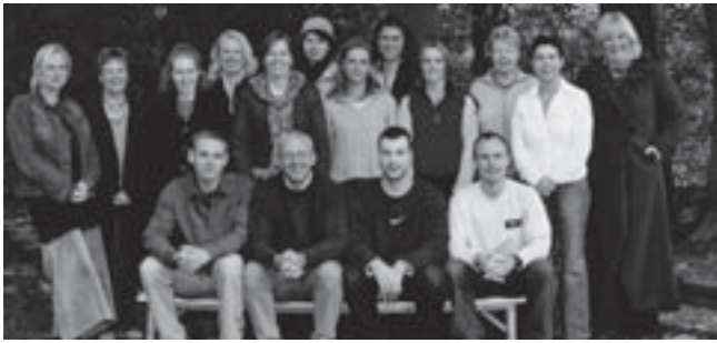
Het schoolteam van GBS De Schakel.