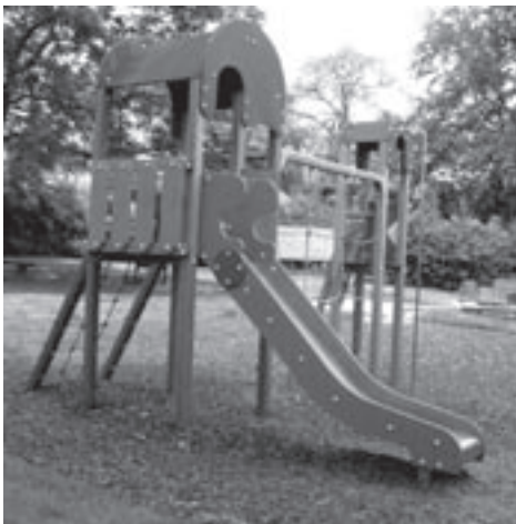
Speelpleintjes worden vernieuwd.

> Een gespecialiseerd studie bureau (Iris Consulting) is momenteel bezig met de opstelling van het gemeentelijk structuurplan. De startnota wordt ter kennisgeving aan de gemeenteraad voorgelegd. Deze uitgebreide startnota kwam tot stand na overleg met de technische werkgroep en de stuurgroep waarin vrijwilligers zetelen uit enkele sociaal-culturele verenigingen en instellingen van de gemeente. In het septembernummer gaan we dieper op dit werkdocument in.