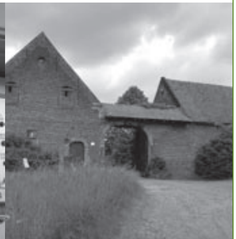
Linkebeekse Feesten in Perckhoeve.