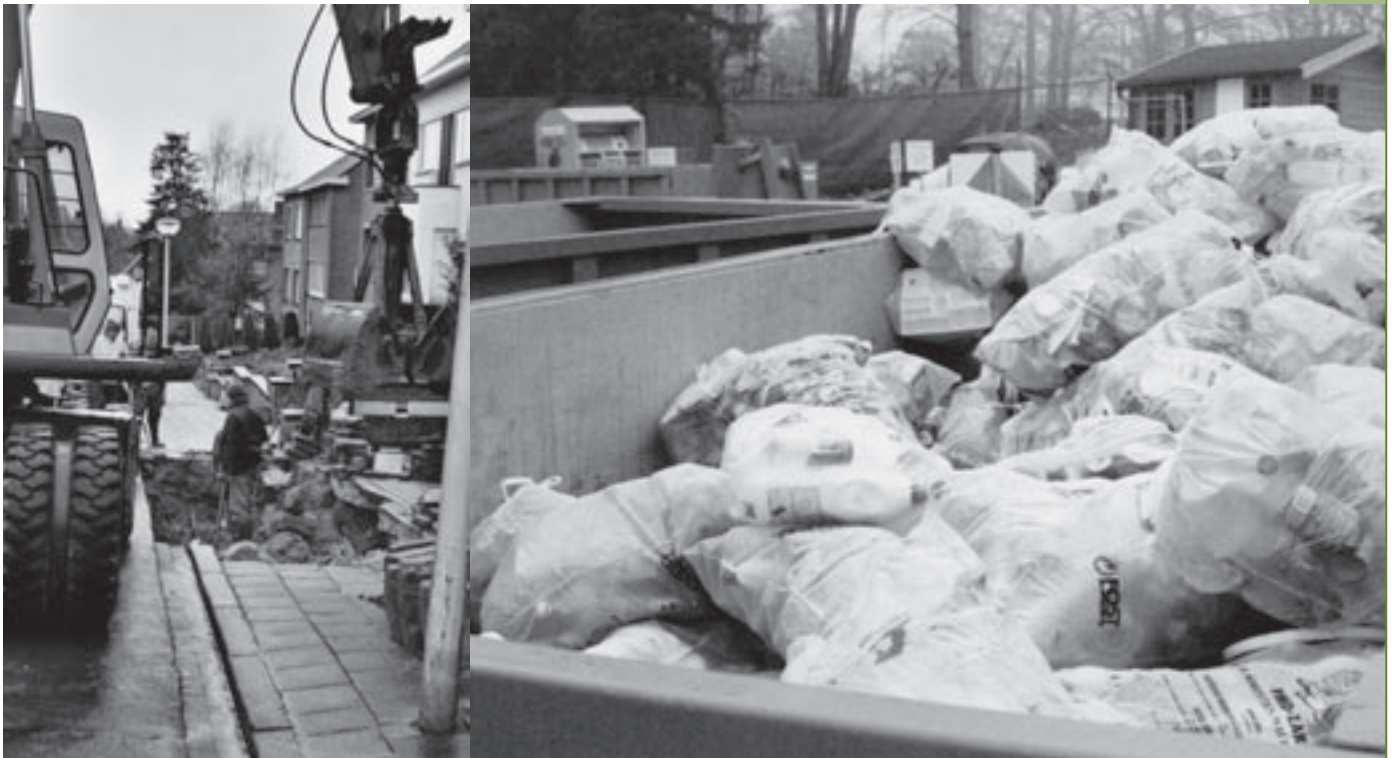
Een plotse inhaalbeweging bij de openbare werken. De Linkebeekenaars zamelen hun afval steeds selectiever in. Heeft het gemeentebestuur iets te bewijzen?