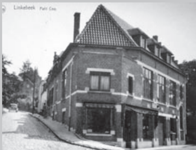
Le Petit Coq