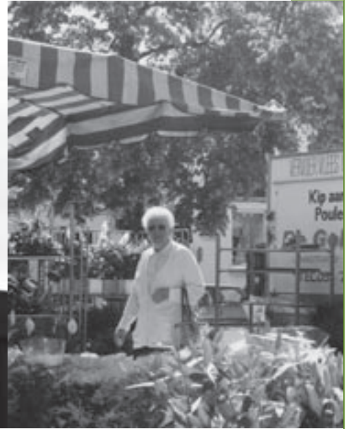
De opstelling van de markt wordt gewijzigd.

komt de dienst grondbeleid versterken en woont eveneens in Limburg, maar overweegt naar het Brusselse te verhuizen.