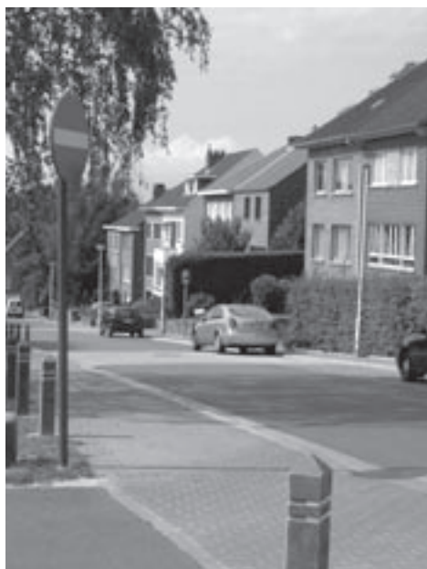
'Zone 30' in Van Dormaelstraat wordt niet nageleefd.