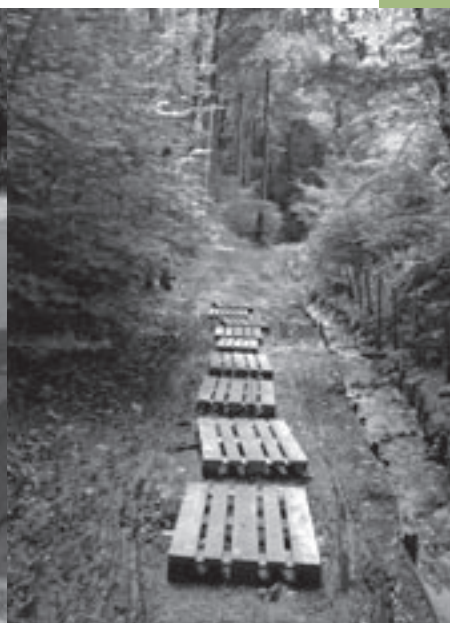
Houten paletten in het Wijnbrondal om drassige stroken te overbruggen.

> De volgende vraag handelt over de slechte toestand van het Wijnbrondal, van de wandelwegen in het algemeen en van vele voetpaden. De wandelweg door het Wijnbrondal wordt steeds moeilijker begaanbaar. Onbekenden legden onlangs zelfs houten paletten over de drassige stroken. Het schepencollege zegt hiervan geen weet te hebben. "Het studiebureau doet momenteel zijn werk", is het antwoord van de bevoegde schepen. Wat de overige wandelpaden betreft, beweert zij dat die wel onderhouden worden. De oppositie betwist dat. Diverse paden zijn op sommige plaatsen moeilijk begaanbaar door overvloedig onkruid. "Voor de herstelling van de voetpaden is de aanbestedingsprocedure lang en moeilijk", verklaart de schepen. De oppositie erkent dit, maar herhaalt haar voorstel om ieder jaar een nauwkeurige planning op te maken voor de verbetering of aanleg van voetpaden, want "de inwoners worden het beu om telkens met allerlei excuses te worden afgescheept als ze aanklagen hoe slecht sommige voetpaden erbij liggen".