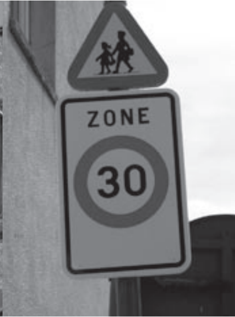
'Zone 30' in de Perkstraat.