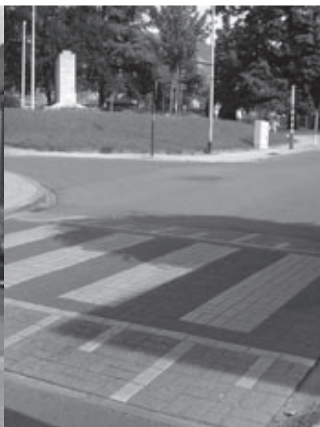
Verkeersdrempels moeten worden aangepast.