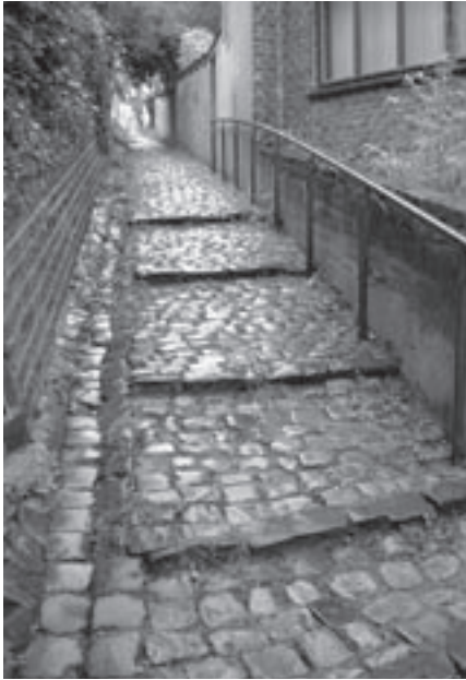
De trap van het Pastorijpad.