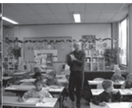
Het eerste leerjaar van GBS De Schakel.