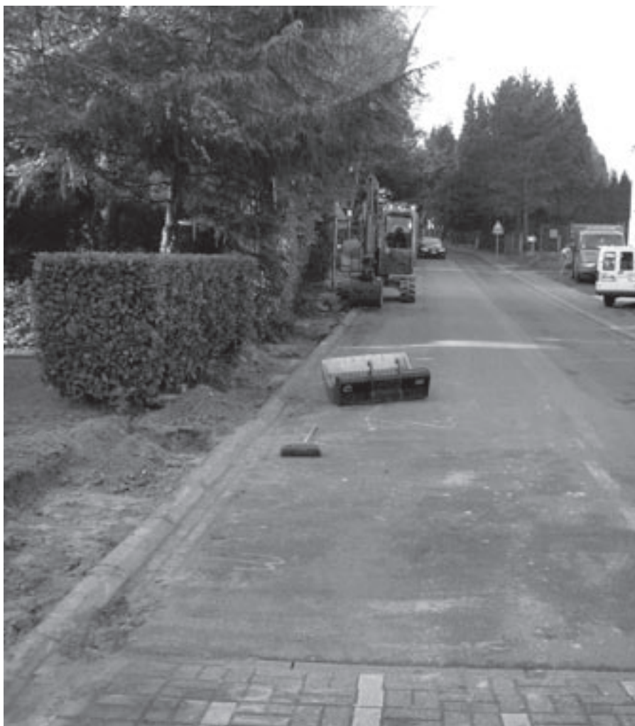
Begin van de werken in de Molenstraat.

Tijdens de gemeenteraad van 18 oktober ontstond er verwarring over het al of niet bestaan van een voetpad tussen het Kleiveld (hoek met Kerkveld /Bon Faro) en de Lange Haagstraat (nabij rusthuis Belvédère). De natuurvereniging LAHN had bij het schepencollege aangedrongen op het opnieuw begaanbaar maken van dat voetpad, aangezien een plaatselijke landbouwer de weg elk jaar omploegt. De oppositie was enigszins verbaasd dat het schepencollege bereid was op dat verzoek in te gaan, omdat dit stukje weg in 1998 door de gemeenteraad officieel, meerderheid tegen oppositie, werd afgeschaft. De meerderheid scheen dit niet meer te weten en na onderzoek blijkt nu dat de Bestendige Deputatie van de Provincie destijds de beslissing tot afschaffing van deze weg nooit heeft goedgekeurd, maar dat de landbouwer ervan uitging dat, na de beslissing van de gemeenteraad, de weg effectief omgeploegd kon worden. Tijdens de laatste gemeenteraad heeft LK2000 aan de burgemeester gevraagd of deze weg dan opnieuw in gebruik wordt gesteld of niet. Voor de voetgangers op deze gevaarlijke plaats zou het alvast een goede zaak zijn.