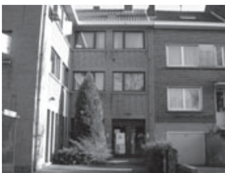
Het toekomstige bijgebouw van het gemeentehuis.

> Als gevolg van een nieuw decreet worden vanaf 1 april van volgend jaar de participatieraden in de scholen door schoolraden vervangen. In de participatieraden (niet te verwarren met de ouderaad) zetelden de schooldirecteur en twee leden van het schoolbestuur (voor gemeentescholen is dat de gemeenteraad), van de ouders, van het personeel en van de lokale gemeenschap. In de nieuwe schoolraden zullen het schoolbestuur en de directeur geen zitting meer hebben, maar wel de leerlingen. Voor lagere scholen ligt dat minder voor de hand en moet dat enkel op uitdrukkelijk verzoek van de leerlingen. Schoolraden krijgen een adviserende bevoegdheid en plegen hiervoor overleg met de schooldirectie en (voor Linkebeek) het gemeentebestuur. De gemeenteraad keurt voor beide gemeentescholen de oprichting van een schoolraad goed, alsook het verkiezingsreglement voor de aanduiding van de vertegenwoordigers van het onderwijzend personeel en van de ouders.