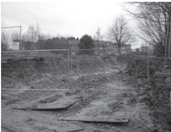
Werken aan Hess de Lilez.

In de kerktoren komt er dan toch een GSM-antenne. De firma Mobistar deed daarvoor een aanvraag. Het schepencollege bracht hierover in maart 2004 een ongunstig advies uit omwille van "de onduidelijkheid die er bestaat over de mogelijke schadelijke gevolgen die de stralingen van een GSM-antenne zouden meebrengen". De ambtenaar van Stedenbouw heeft de vergunning echter afgeleverd met de motivering dat "alle GSM-installaties moeten voldoen aan de federale stralingsnormen en deze beduidend strenger zijn dan de normen uitgevaardigd door de Wereldgezondheidsorganisatie, zodat aangenomen mag worden dat er geen gezondheidsrisico's zijn". In de torenspits komen zes paneelantennes; lager in de toren twee schakelkasten. Aangezien er aan het uitzicht van het kerkgebouw niets verandert, had de dienst Monumenten en Landschappen geen bezwaar tegen de plaatsing van de antennes. Of dat ook zo is met de omwonenden is niet zo zeker, want er werden de voorbije jaren al diverse acties ondernomen tegen de plaatsing van dergelijke antennes. Derden kunnen een beroep tot nietigverklaring instellen bij de Raad van State, binnen 60 dagen nadat ze kennis nemen van de beslissing. De kerkfabriek krijgt voor de plaatsing van deze antennes jaarlijks een niet onaardige vergoeding uitbetaald.