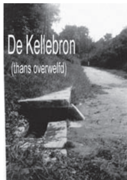
Kellebron, J. Geysels, 1942.