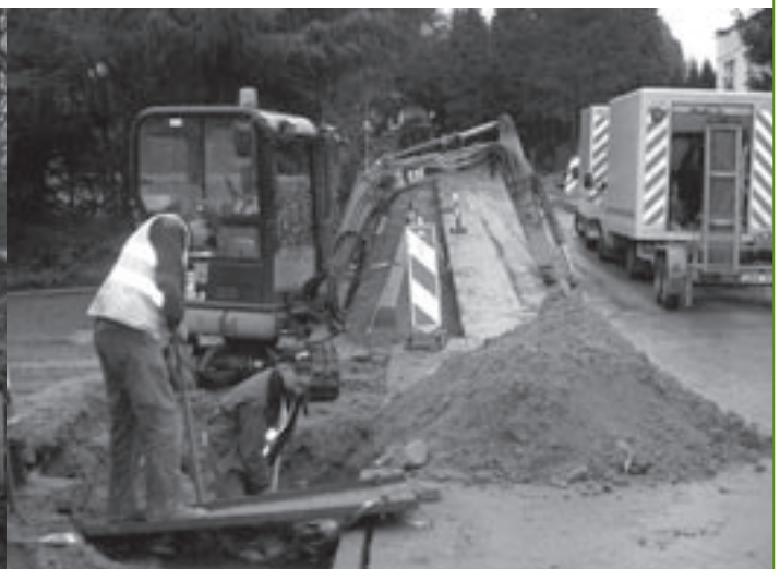
Werken aan de Molenstraat.