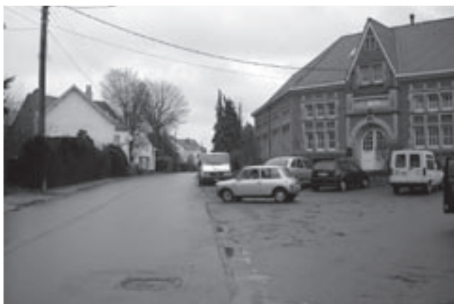
De gemeenteraad keurde de derde fase van de Hollebeekstraat goed.

De oppositiewoordvoerder stelt hierop vast dat het om een beleidsprobleem gaat, aangezien de burgemeester en zijn meerderheid niet tijdig hebben ingezien dat ze met hun financieel beleid op het verkeerde spoor zaten en nagelaten hebben de nodige beleidsopties te nemen om de nu opgedoken financiële moeilijkheden te vermijden. De raadsleden van LK2000 gaan niet akkoord met het uitstel van de begroting 2005 en keuren de vaststelling van de voorlopige twaalfden niet goed.