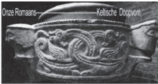
Doopvont, Koninklijk Instituut Kunstpatrimonium, 21 maart 2001.