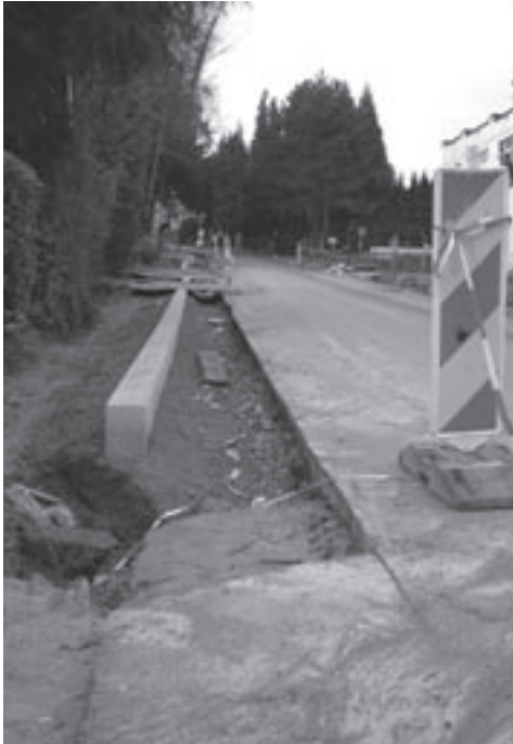
De werken aan de Molenstraat.