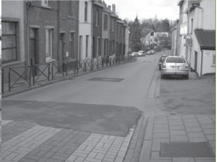
De verkeerstesten in de Stationsstraat waren een maat voor niets.

wordt de belasting van het Vlaams Gewest aangerekend (voor 2004 was dat 2,5%): 2.000 \text{ euro} \times 2,5\% = 50 \text{ euro} . Op die 50 euro betaalt het echtpaar ook provinciale en gemeentelijke opcentiemen. De provinciale bedroegen vorig jaar in Vlaams-Brabant 332, de gemeentelijke opcentiemen in Linkebeek 960. Voor wat betreft de gemeentebelasting kwam dat neer op 50 \text{ euro} \times 960 \text{ opcentiemen} = 50 \times 9,6 = 480 \text{ euro} . Met de verhoging tot 1.200 opcentiemen zal de belasting 50 \text{ euro} \times 1.200 \text{ opcentiemen} = 50 \times 12 = 600 \text{ euro} bedragen. Dat betekent een verhoging van 120 euro.