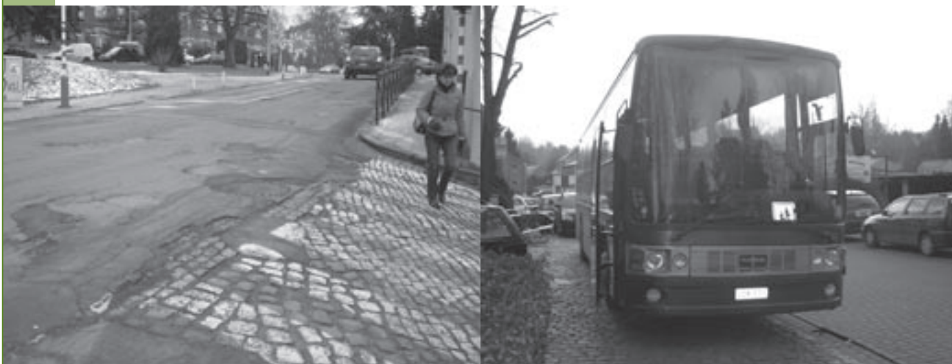
Weg in slechte staat.