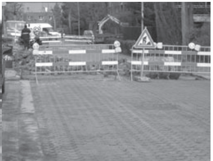
Werken aan de Brouwerijstraat.