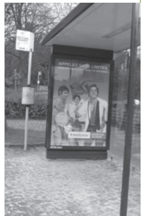
Alleen Franstalige reclame in de bushokjes.

ren. Vorig jaar werd een elektronisch systeem met bijhorend programma-uurwerk om de klokken te luiden geplaatst. De gemeente nam de kostprijs van het uurwerk op zich (ruim 2.000 euro), omdat zij hiertoe bij wet verplicht is (in elke gemeente moet minstens één openbaar uurwerk zijn); de kerkfabriek bekostigde het elektronische systeem (ongeveer 3.300 euro). In de kerktoren hangen nu drie klokken, één van 800, één van 600 en één van 100 kg. Het luiden van het uur en de mis gebeurt elektronisch. Met een afstandsbediening kan men ook de grote klok drie hamerslagen laten geven en de drie klokken samen of afzonderlijk activeren.