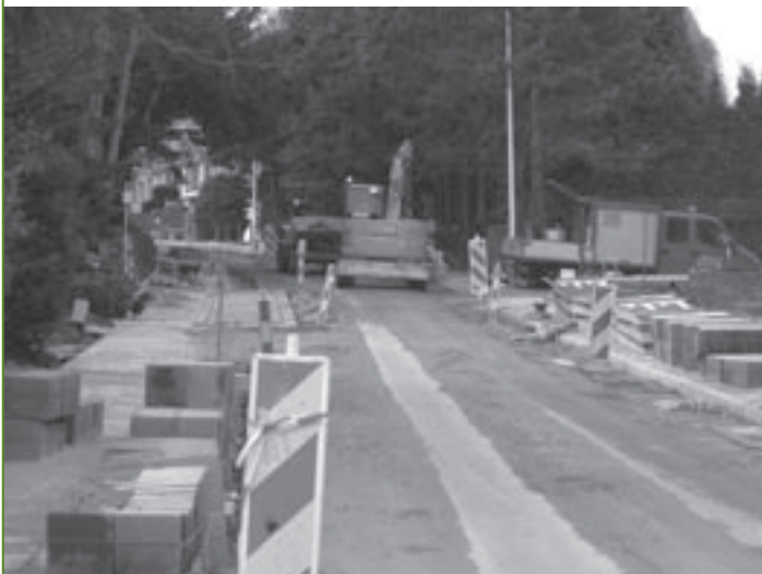
Werken aan de Molenstraat.