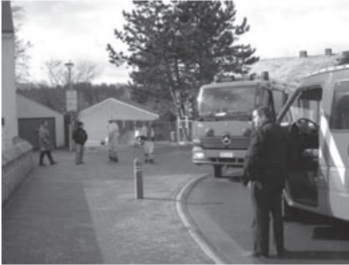
Gasalarm in de school.