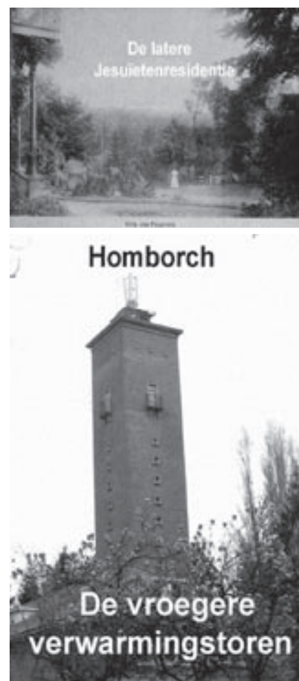
Enkele foto's bij 'Linkebeek vroeger en nu. De eigenaars in de wijk Homborch'.

In geheime zitting gaat de gemeenteraad akkoord met de aanstelling van een dertigtal studenten die tijdens de zomervakantie worden ingezet voor de speelpleinwerking. Er worden nog acht studenten aangesteld: drie voor administratief werk; vijf voor het onderhoud van de wegen.