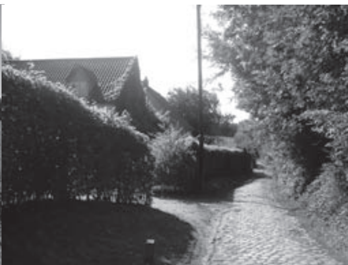
In de Rodestraat blijft sluijperkeer voor gevaar zorgen.