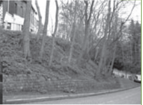
Het voetpad en talud aan de Zavelstraat zakt stilaan weg.

ken straten geen doorstroombaanfunctie hebben. Misschien had de burgemeester in de Gemeentelijke Mededelingen van vorige maand de automobilisten attent kunnen maken op het belang van een 'zone 30' in de schoolomgeving. Hij had er kunnen aan toevoegen of er in de onmiddellijke toekomst al dan niet nog aanpassingswerken gepland zijn om deze zone duidelijker af te bakenen. Dat was zinvoller geweest dan het therapeutische praatje over stress dat hij als een volleerde psychiater aan zijn onderdanen voorschotelde.