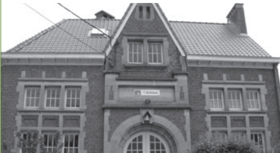
Een 'folkloristisch feest' in Het Schoolke bleek een 'Goa-fuij' met rare snuiters.

Bij het begin van het nieuwe schooljaar werd de invoering van een 'zone 30' in de omgeving van elke school verplicht. Voor een keer was onze gemeente hiermee tijdig in orde, want de verkeersborden staan er al een paar jaar: in de Brouwerijstraat, de Van Lishoutstraat en de Sint-Sebastiaanstraat. Daarmee is de veiligheid van de kinderen echter niet gewaarborgd. Zeker niet omdat de automobilisten de eerder kleine verkeersborden amper opmerken en bijgevolg ook amper naleven. Willen de verkeersborden effect sorteren, dan moet ook de verkeersinfrastructuur worden aangepast, zodat de weggebruiker duidelijk merkt dat hij een 'trage' zone binnenrijdt. Variabele verkeersborden 'zone 30', die oplichten op momenten dat de school begint of eindigt, zouden hier ook kunnen, omdat de betrok-