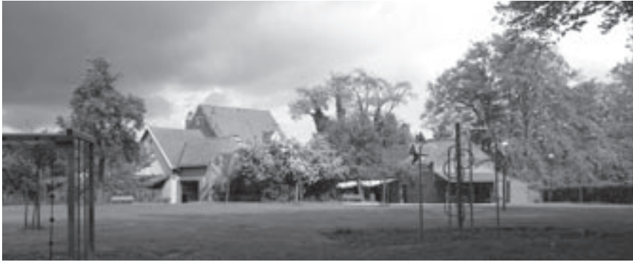
De conciërge van het gemeentelijk cultureel centrum Hoeve Holleken spreekt geen woord Nederlands.