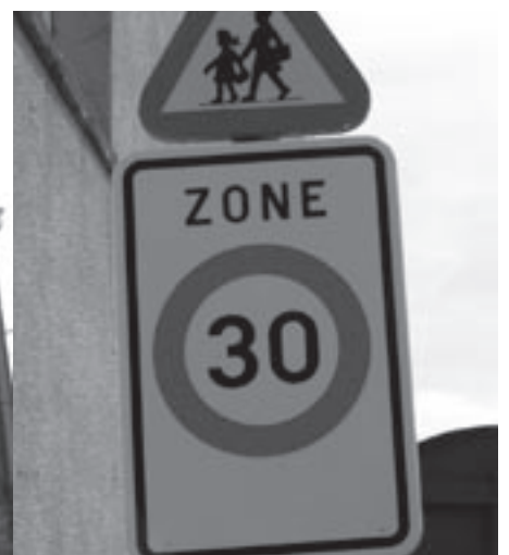
Zone 30 aan de school wordt maar moeizaam nageleefd.