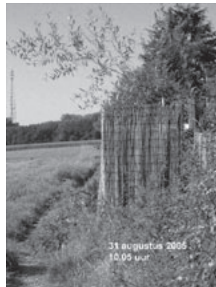
Een wandelweg, illegaal afgesloten door een aanpalende bewoner.