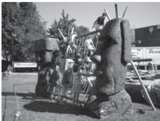
Teek-it-iezie stak een spectaculair avonturenparcours in elkaar.