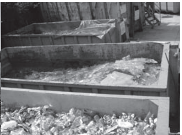
Anno 2004 werd er heel wat afval opgehaald of naar het containerpark gebracht.