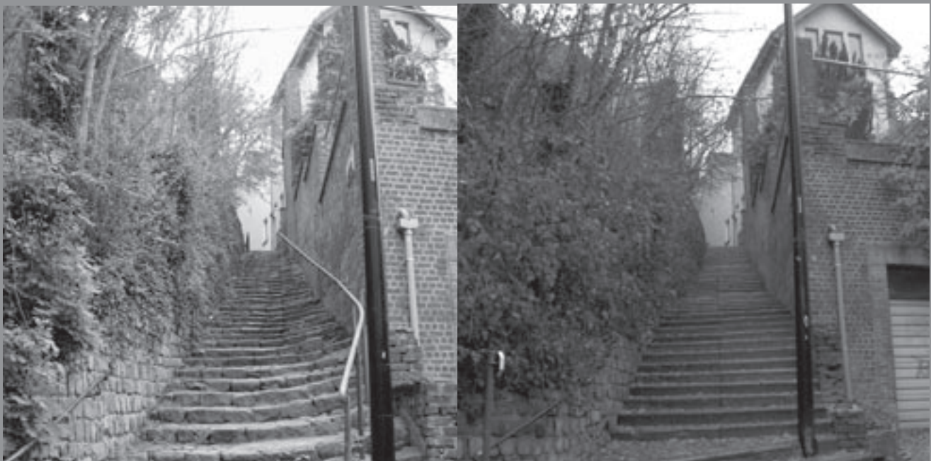
De trap van de 100 jarige