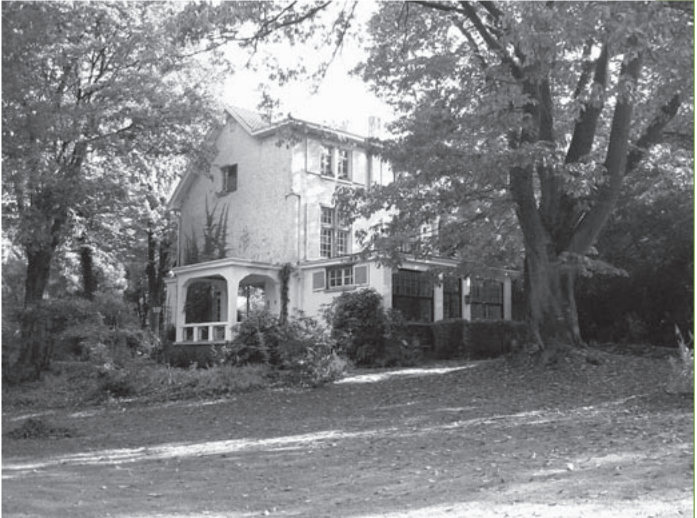
Huis Lismonde ligt tamelijk verborgen.

Linkebeek moet uitmonden. Langs de overkant komt de kleine waterzuiveringsinstallatie, die grotendeels in de grond verstopt zal zitten en dus perfect in de landelijke omgeving geïntegreerd zal worden. Zulke installatie bestaat uit een voorbezinktank waarin er zich slib opstapelt dat meermaals per jaar geruimd moet worden en uit twee pompen die het afvalwater naar de sedimentatiebekkens pompen en nadien naar de twee infiltratierietvelden. Nadien kan het gezuiverde water ook naar de beek, waar wel een klein bufferbekken komt.