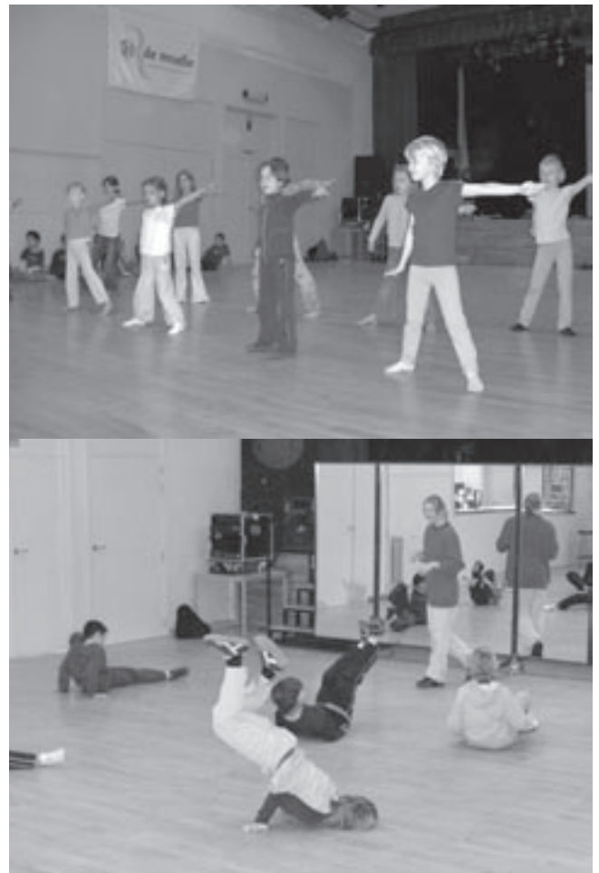
De workshops voor kinderen van de Gezinsbond en GC de Moelie in de herfstvakantie kenden veel bijval.