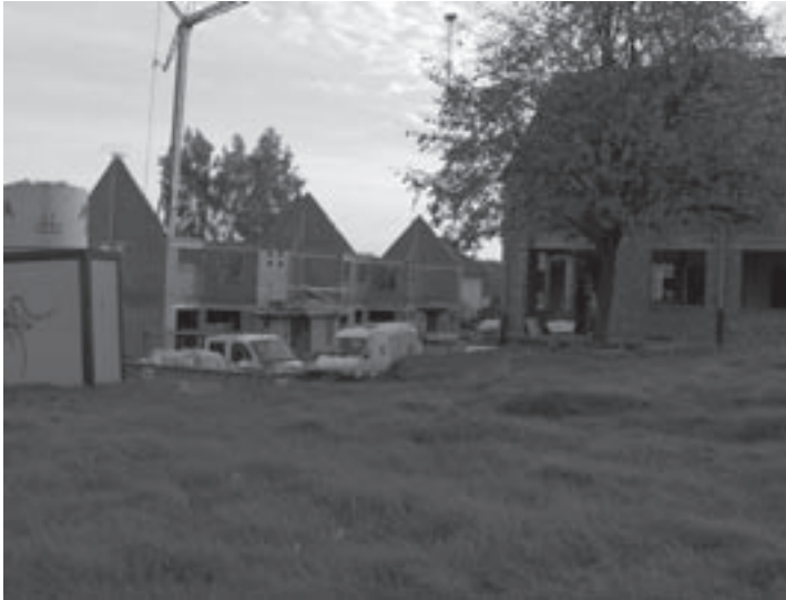
Het project Hess-de-Lilez raakt stilaan afgewerkt.

paar straten overbleven. Van oppositiekant werd toen al gepleit om enkel de straten te vermelden waar de maatregel van kracht bleef. Nu blijkt dat dit volgens de overheid ook zo moet, zodat het goedgekeurde reglement in die zin wordt aangepast. Enkel in de Kasteeldreef, de Esselaar en een paar kleine straten zoals de Braambeziënlaan en een deel van de Grote Baan (achter rusthuis Avondvrede) mogen fietsers nog in beide richtingen rijden. LK2000 had vorig jaar al gesteld dat het in de Kasteeldreef ook niet ongevaarlijk is om tegen het verkeer in te rijden.