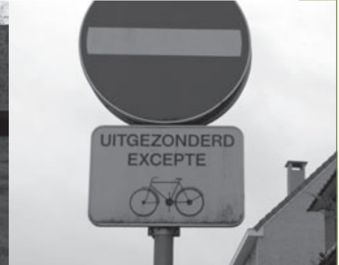
Fietsen in tegenrichting zorgt in de smalle, bochtige Linkebeekse straten soms voor gevaar.

> De burgemeester stelt de begroting van dit jaar aan de gemeenteraad voor. De gewone dienst sluit af met een tekort van 262.000 euro, maar door de 697.000 euro overschot van de vorige dienstjaren wordt dat tekort omgebogen tot een boni van goed 435.000 euro. De gemeente put haar voornaamste inkomsten uit het Gemeentefonds (483.000 euro), int bijna 3 miljoen belastingen en ontvangt van de Vlaamse Gemeenschap 790.000 euro voor het onderwijs. Een meevaller voor dit jaar is het bijzonder dividend van Iverlek, goed voor 208.000 euro, door de verkoop van Telenetaandelen. De voornaamste uitgaven gaan naar het personeel en de werking van de administratie (ongeveer 770.000 euro), de