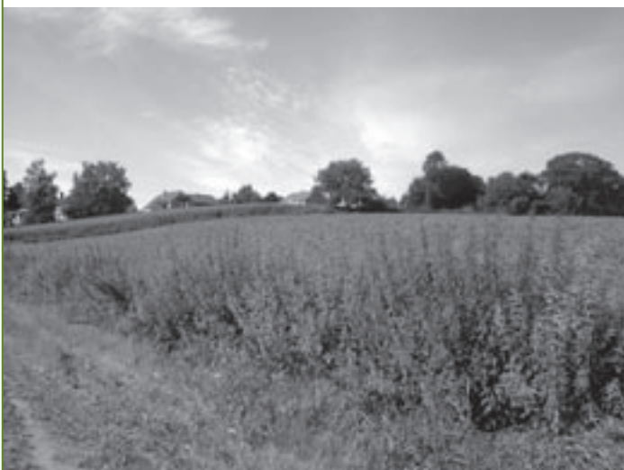
Kleindal: de iets minder rustige exclusieve hoek van Linkebeek.

Voor de afwateringsproblemen is er een oplossing in de maak. De realisatie ervan zal wel ten vroegste voor over een paar jaar zijn. Het aangestelde studiebureau is klaar met het voorontwerp en koos voor de oprichting van een kleine waterzuiveringsinstallatie (KWZI). In Vlaanderen werden de voorbije jaren al talrijke KWZI's gerealiseerd. De Vlaamse Milieumaatschappij kent hiervoor immers belangrijke subsidies toe. De Klaprozenweg en de Kleindalstraat krijgen voor regen- en afvalwater een gescheiden rioleringsstelsel. In de nieuwe Klaprozenweg is enkel de aanleg van één bijkomende riool nodig. Alle woningen, met of zonder verliespunt, moeten op de nieuwe riolering aansluiten. Waar de bebouwing stopt, zal de riool met regenwater langs de ene kant van de weg in een open gracht terechtkomen, die in de lager gelegen