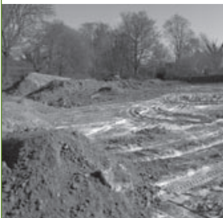
Weide in de Rodestraat.

Voor de heraanleg van de straat en de voetpaden van de Perkstraat keurde de gemeenteraad in november het lastenboek en de raming van de kostprijs goed. De aanbesteding leverde vier inschrijvingen op en het is een firma uit Zemst die met een prijsopofferte van 340.000 euro de werken zal uitvoeren. De raadsleden van LK2000 hadden zich bij de goedkeuring van de werken onthouden, omdat zij van oordeel waren dat er in Linkebeek wel andere straten en voetpaden zijn die dringender aan verbetering toe zijn.