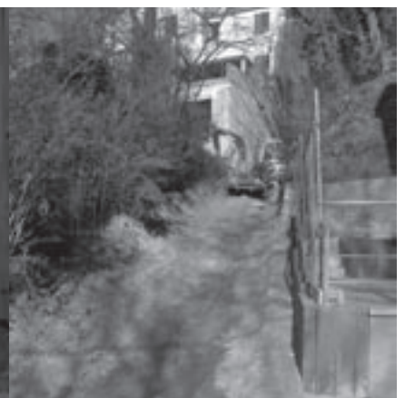
Werken aan de grote kerktrap.