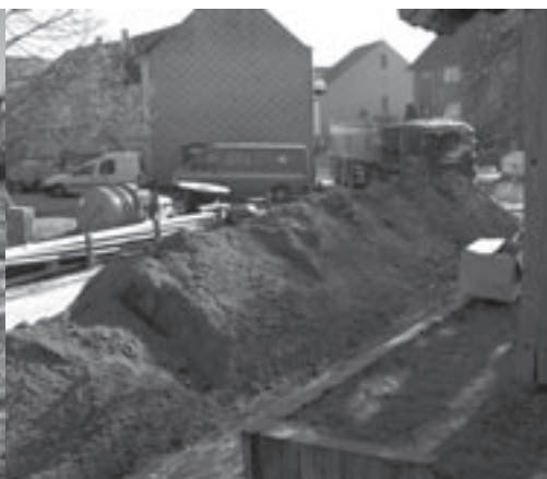
Werken aan de Hollebeekstraat.