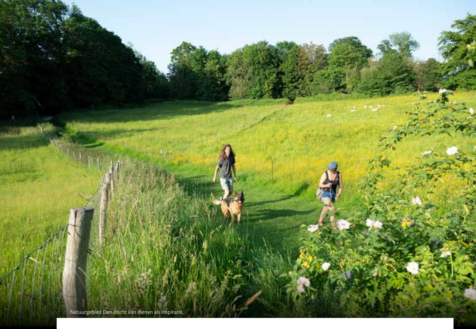
Natuurgebied Den Bocht kan dienen als inspiratie.