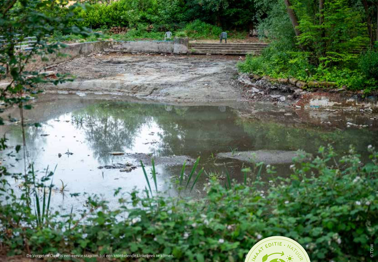
De Vergeten Oase is een eerste stap om tot een kronkelende Linkebeek te komen.

gestoken. Dat bleek niet de goede strategie. Beter is om het water hogerop vast te houden in combinatie met het openleggen van de waterloop. De Vergeten Oase is een eerste stap om tot een kronkelende Linkebeek te komen. We zouden graag hetzelfde doen op de site van het aangrenzende tankstation. De onderhandelingen voor de aankoop van die grond lopen nog.'